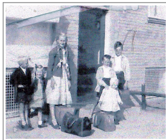
Diget 19 vi er klar til turen til Jylland