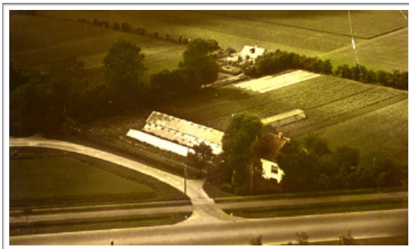
Her er Handelsgartneriet Ejby Mosevej