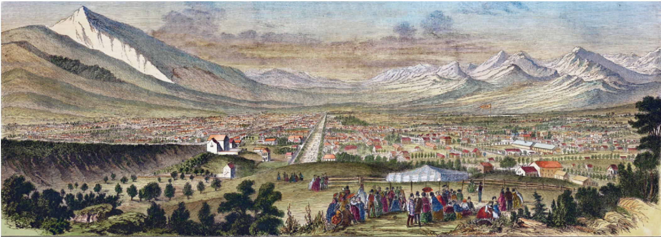
LA NOUVELLE JÉRUSALEM, ou LA GRANDE VILLE DU LAC SALÉ (AMÉRIQUE).