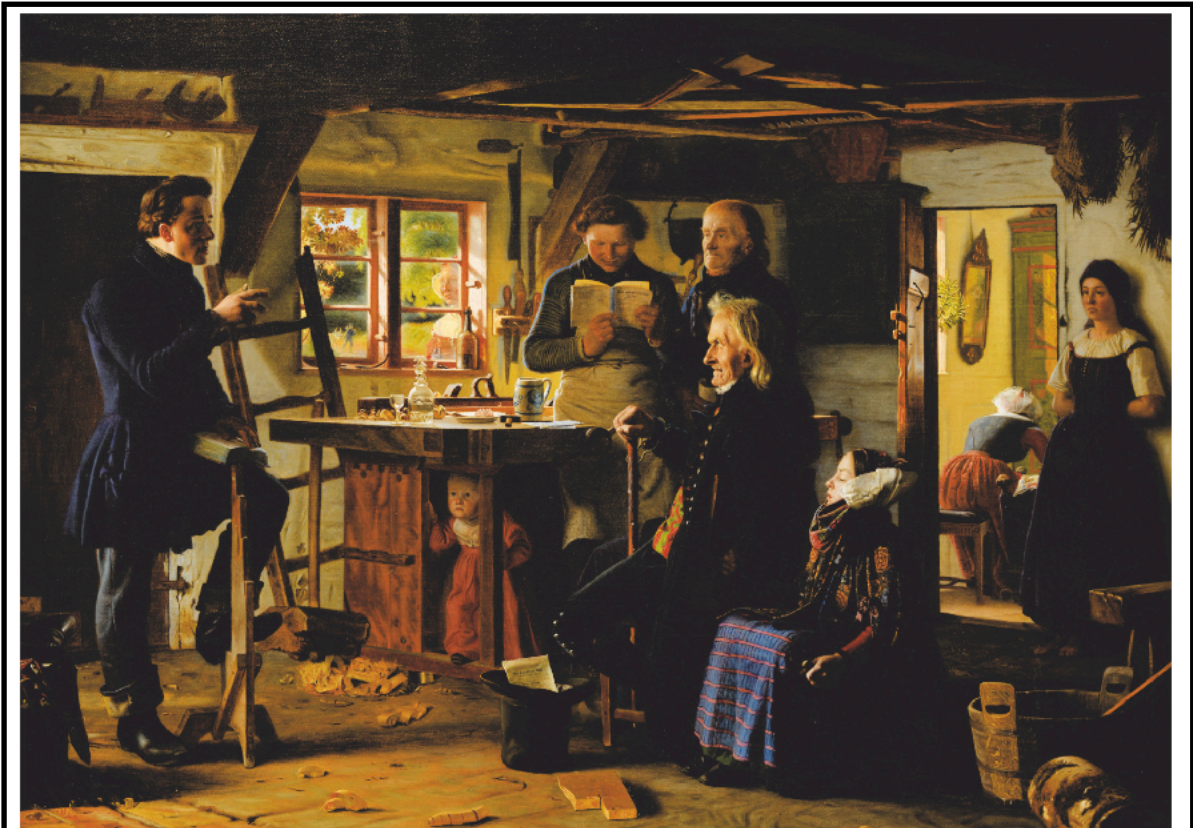
Mormoner på besøg. "Tvende Mormonere er på deres vandring komne ind i et Tømmerhus paa Landet, hvor de ved Prædiken og ved Fremvisning af nogle af deres Sekts Skrifter søge at vinde nye Tilhængere", skrev maleren Christen Dalsgaard på sit billede. Trods mormonernes og især baptisternes mission i 1850'erne forblev hovedparten af de vakte inden for den rummelige folkekirke, hvor de bevarede deres særpræg med tilknytningen til bedehuse/ missionshuse.

Ikke den mindste markvej blev overset af missionærerne. Ja, faktisk var det som om, at jo længere borte fra landsbyerne